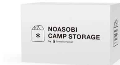
【野遊びキャンプボックス】（サイズ：W70xD38xH45[cm]） スノーピーク製品「ランドロック」の本体とフレームがびったり入るサイズ。