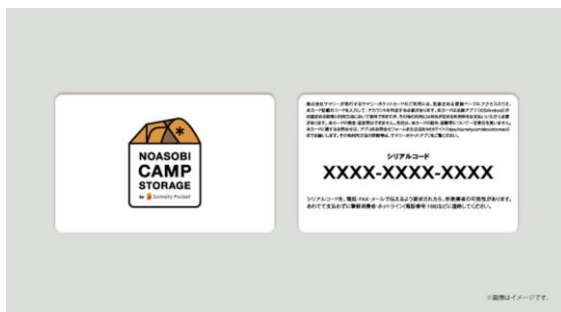
【野遊びキャンプストレージカード】イメージ

ご自宅でのスペース確保や外部倉庫を借りるなどの保管場所に縛られず、簡単な操作で業界最高水準の管理品質を誇る倉庫が道具を大切に保管致します。さらに便利に、気軽に野遊びを楽しむためのサービスを提供いたします。