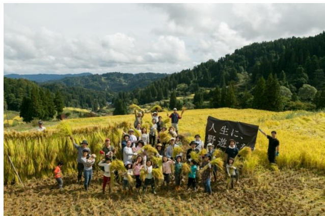
秋の収穫を楽しむキャンプイベント