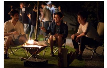
ビジョンシェアリング 焚火を真ん中に置き、みんなで車座になって火を囲むと、会話が自然に弾みます。

※このほか、 キャンプ場で宿泊 するパターンや、キャンプ体験に抵抗を感じる方のために日中は屋外でCAMPING OFFICEを体験し ホテルや旅館に宿泊 するパターン、 都心の屋外スペースや飲食店を会場 に実施するパターンなど、参加規模やご要望に合わせてアレンジ可能となっております。