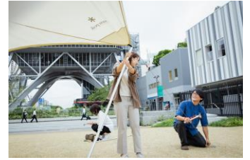
チームビルディング研修 複数人でテント設営をしていただき、チームビルディングの体験をします。

コロナ禍で入社する2021年春新卒社員を対象とした研修プログラムです。密にならない屋外でのテント設営、ミーティングや焚火トークなど、キャンプ体験をベースに、相互理解によるチームワーク力の向上や社員としてのロイヤルティ醸成をはかります。また、コロナ禍で直接顔を合わせる機会の少ない社員同士のコミュニケーションの場としても活用できます。研修内容は、ご要望に応じて変更・調整することが可能です。