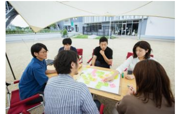
クリエイティビティワーク研修 自社の可能性・認知・視点を広げるためのコンテンツ。チームを組み、将来どんな取組みが自分たちに作れるかを話します。