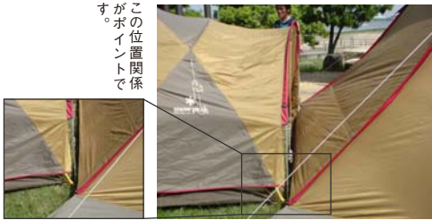
この位置関係 がポイントで

手順① まず初めにリビングシエル を設営し(ペグダウンも行 います。)アメニティドーム を写真のように配置しま す。 アメニティドームの前室は 全てロールアップした状態 にします。 (まだこの時点でアメニ ティドームはペグダウンし なくても大丈夫です。)