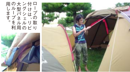
ロープの取り 付けは、リビ ングシエルの 大型パネル用 のロープを利 用します。

手順① まず初めにリビングシエル を設営し(ペグダウンも行 います。)アメニティドーム を写真のように配置しま す。 アメニティドームの前室は 全てロールアップした状態 にします。 (まだこの時点でアメニ ティドームはペグダウンし なくても大丈夫です。)