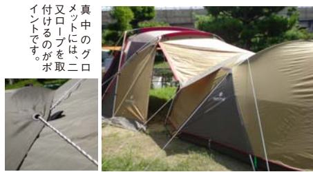
真中のグロ ムネットには、二 又ロープを取 り付けるのがポ イントです。

手順② アメニティドームの前室に ついているロープを使って リビングシエルとアメニ ティドームを繋ぎます。 (こうすることによってア メニティドームをペグダウ ンする「位置」が決まりま す。ロープで繋いだら、今 回の写真でいうと、左側 にアメニティドームを引っ 張る形で、「位置決め」を するのがポイントです。) そして、アメニティドーム をペグダウンをします。