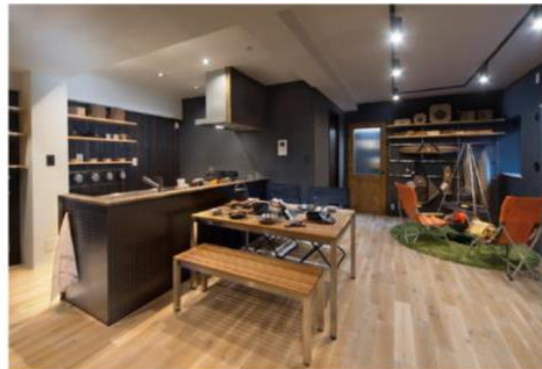
【After】urban outdoor リノベーション