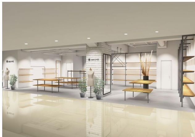
「snow peak 京都藤井大丸」店舗イメージ